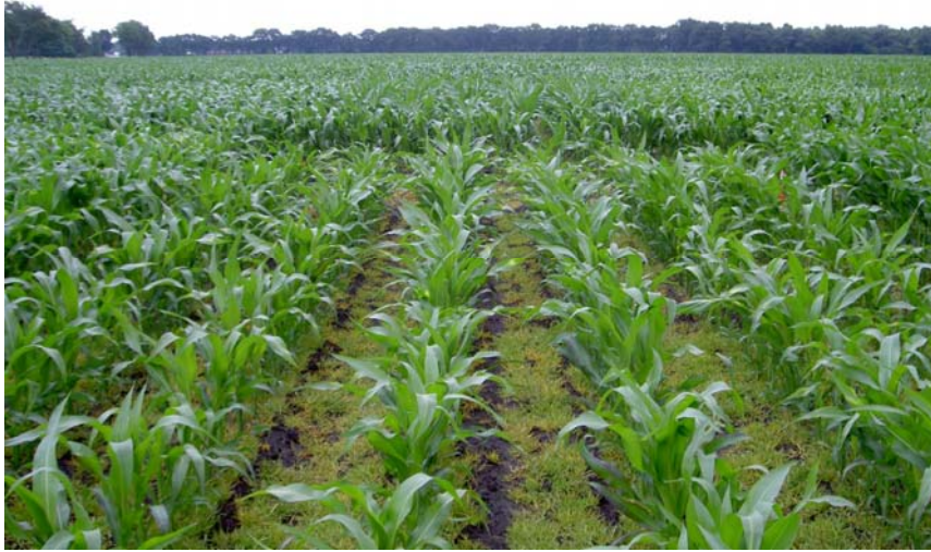
Snelheid grondbedekking is sterk rasafhankelijk