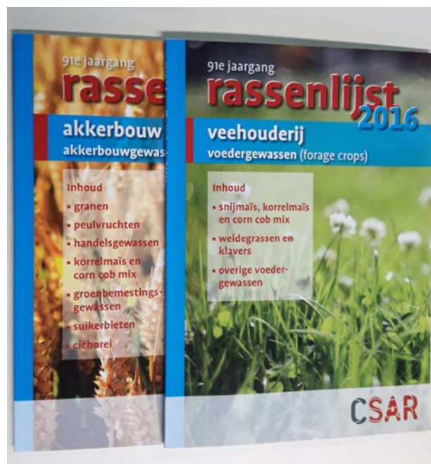
Kies een ras uit de Aanbevelende Rassenlijst

Sinds teeltjaar 2012 worden de rassen in dit onderzoek getest in twee vroegheidsgroepen, zeer vroeg/vroeg en middenvroeg/middenlaat. Dit is aangepast om de opbrengstpotentie en kwaliteit van alle rassen op correcte wijze te bepalen. Uiteindelijk levert dat twee afzonderlijke rassenlijsten op die niet met elkaar te vergelijken zijn.