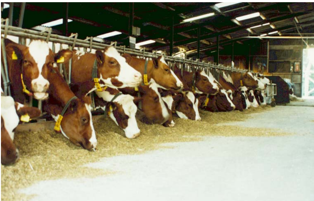
Bestendig zetmeel is goed voor productie in eerste fase van lactatie

Gedurende het groeiseizoen kan men afhankelijk van de kolfontwikkeling het uiteindelijke zetmeelgehalte sturen door vroeger of later te oogsten. Bij zeer vroege rassen, die eerder in het groeiseizoen een bepaald drogestofgehalte bereiken, is de mogelijkheid te sturen groter dan bij middenvroeg rassen.